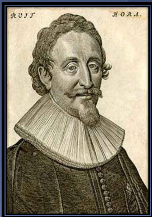
Hugo Grotius (1583-1645)