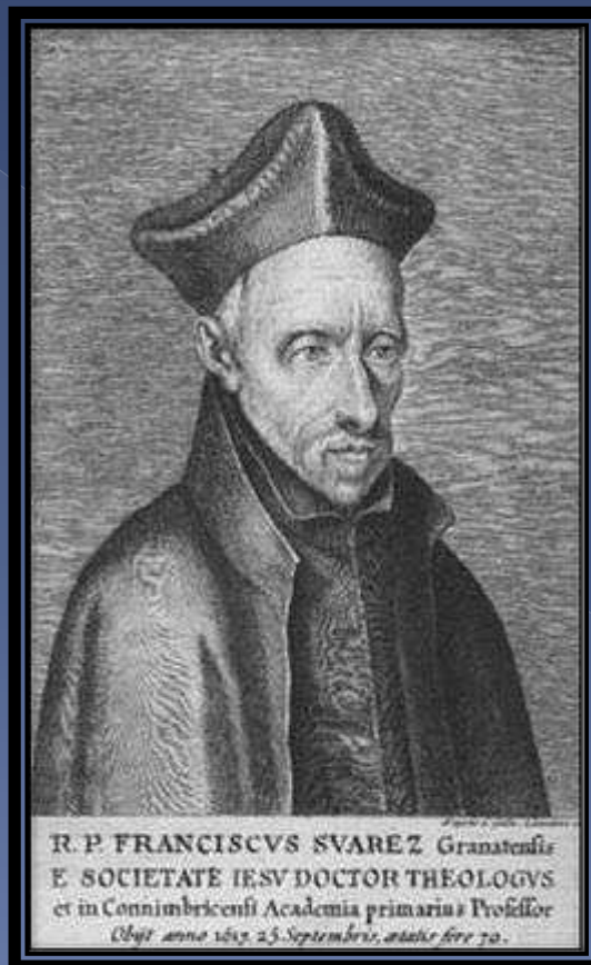
Franciszek Suarez (1548-1617)